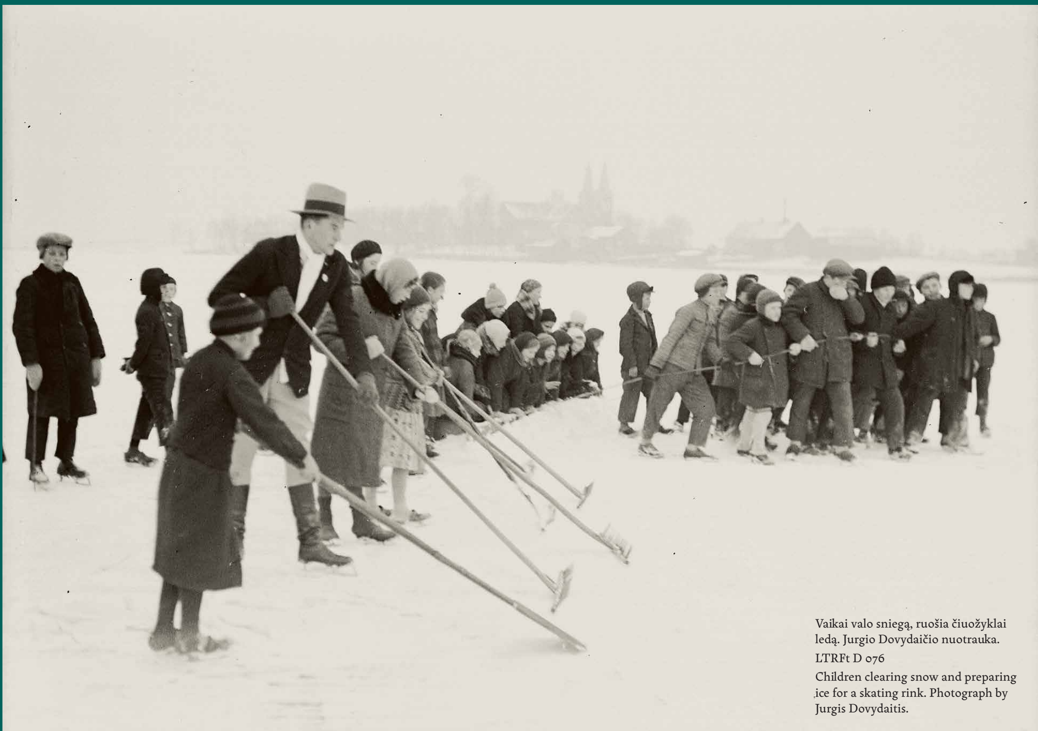
Vaikai valo sniegą, ruošia čiuožyklai ledą.