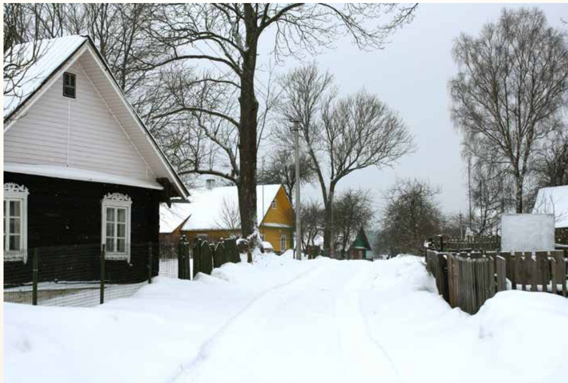
Žižmų kaimas žiemą. Daivos Vaitkevičienės nuotrauka, 2013 m. LTRFt 17364