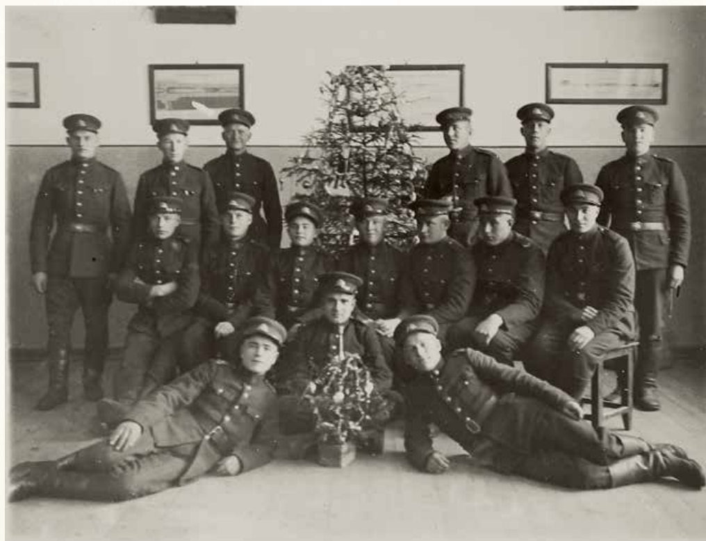
Kalėdų atmintis. Lietuvos kariuomenės kariai. Nežinomo autoriaus nuotrauka, 1924 m. LTRFt 16321