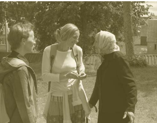
Tautosakos rinkėjos kalbina dainininkę

darbuotojų ekspedicijose ir pavieniui sudaryti rinkiniai, įvairių kultūros ir mokymo įstaigų, kraštotyros entuziastų dovanos.