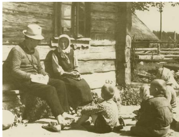
Pasakų klausytis įdomu visiems