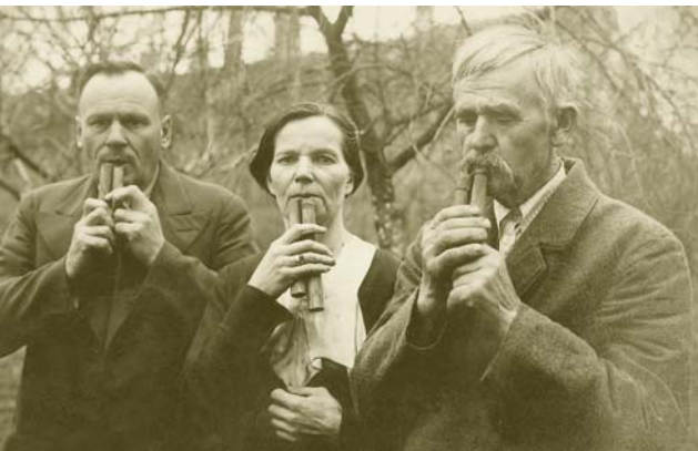
Skudutininkai iš Biržų