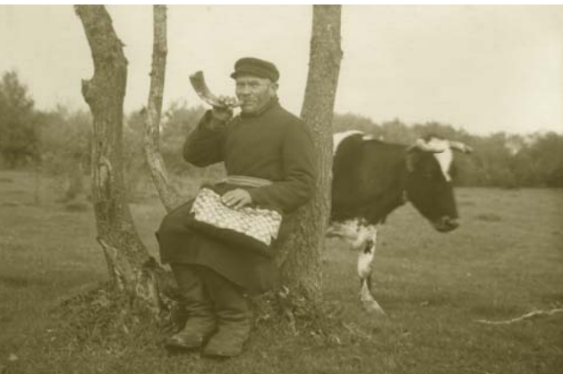
Keržius pučia ožragį

leidžiamame leidinyje „Tautosakos darbai“.