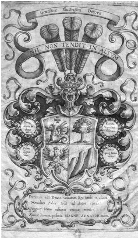
5 pav. Kūrinio Fastigium triplex lapas su Jono Alfonso Lackio herbu ir herbiniu eilėraščiu

dar tris svarbius dalykus: Lackio protėvių pelnytą šlovę, claritas , prie kurios daugiausia prisidėjo jo tėvas Teodoras; šią šlovę sustiprina kitų giminių, daugiausia išiliejusių per vedybas, splendor – didingumas ir taurumas; protėvių paveldą savo dorybėmis ir gautomis pareigomis ( virtutes et honores ) tęsia ir dabartinis Žemaitijos seniūnas. Paskutinė odė baigiama pompastiškai, labiausiai akcentuojant naujojo pareigūno priedermes, teisingumą bei palankumą katalikų tikėjimui: