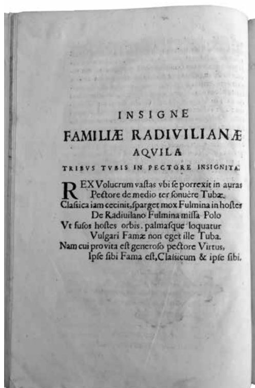
6 pav. Kūrinio Samogitiae triumphantis argumentum (1647), skirto Jonušui Radvilai, prozinės dalies pradžia (VUB III 18133)