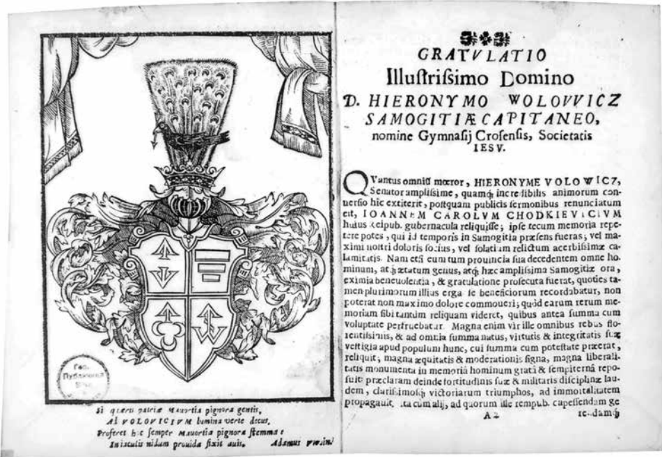
2 pav. Kūrinių Gratulationes lapas su Jeronimo Valavičiaus herbu ir herbinio eilėraščiu

Pirmos dalies pradžioje ketvirčiuotame skyde puikuoja jungtinis Jeronimo Valavičiaus herbas, kurį sudaro atskiri herbai: Bogoria (Bogorija) , Korczak (Upės) , Tiškevičius (Čiškevičius) ir Sopočko 17 . Po juo – eleginiu distichu parašytas herbinis eilėraštis (2 pav.):