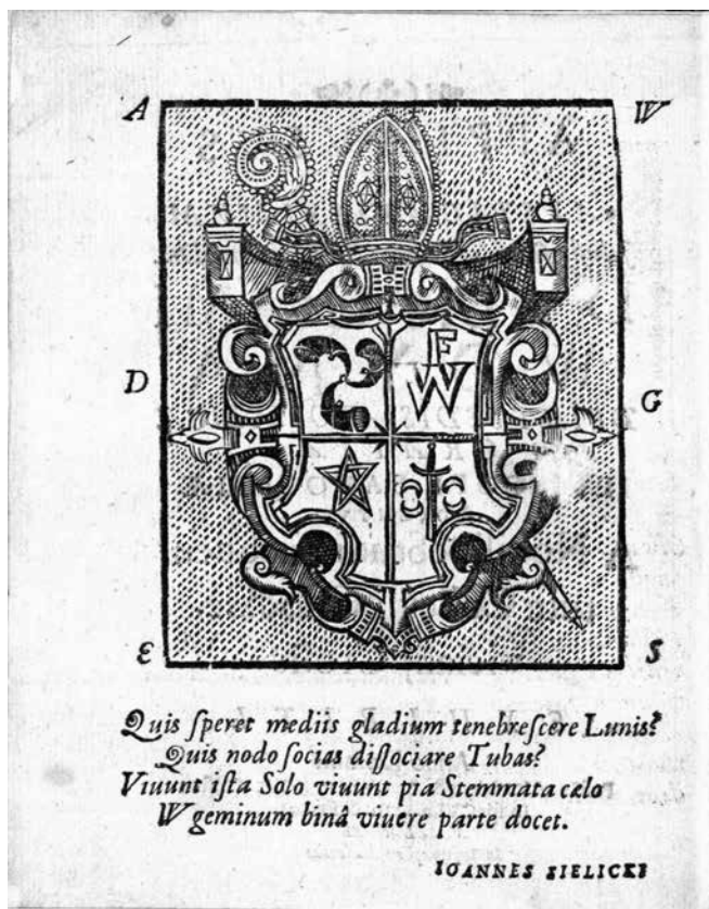
3 pav. Kūrinio Applausus lapas su Abraomo Vainos herbu ir herbiniu eilėraščiu

Kaip matyti iš lentelės, kūrinį sudaro kelios pagrindinės dalys. Kūrinys pradedamas herbiniu eilėraščiu (3 pav.).