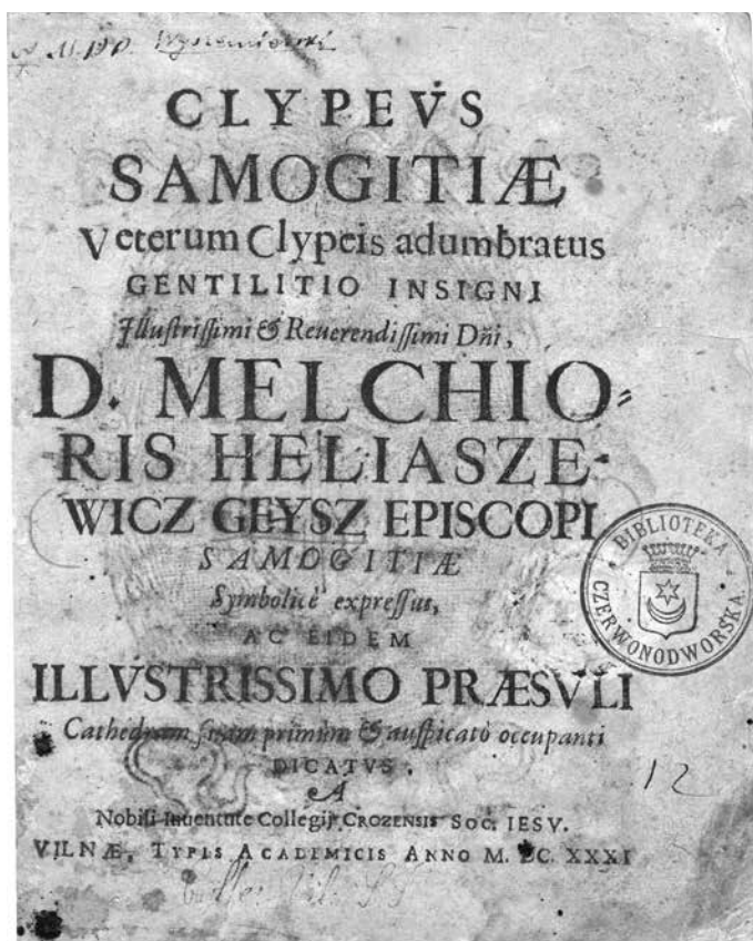
4 pav. Kūrinio Clypeus Samogitiae (1631), skirto Merkeliui Elijoševičiui Geišui, antraštinis lapas