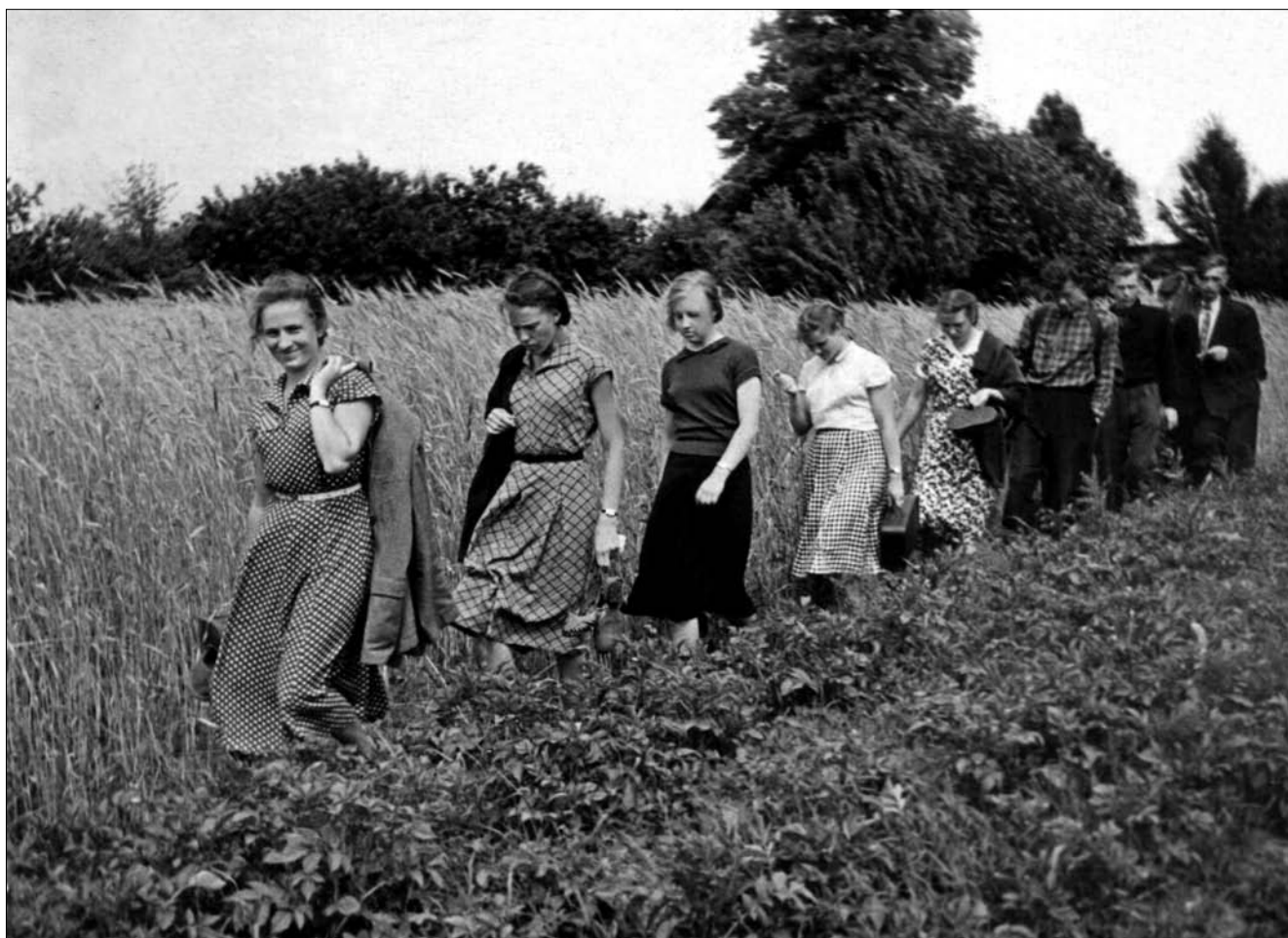
Vilniaus universiteto studentai ekspedicijoje. Baltarusija, Varenavo r., Ramažonių k. 1957 m. LTRFt 2204.

grafinis ansamblis tęsė repeticijas. 1971 m. Lietuvos valstybinės filharmonijos salėje buvo surengtas jau dviejų dalių koncertas. Pirmojoje dalyje buvo atliekama sutartinių programa, o antrojoje – XIX a. pabaigos – XX a. pradžios Lietuvos etnografinių regionų (Aukštaitijos, Žemaitijos, Klaipėdos krašto) dainos, šokiai, instrumentinė muzika. Atlikėjai vilkėjo Dalios Mataitienės atkurtus autentiškus įvairių regionų kostiumus. Anuomet šis pasirodymas buvo meniškiausias lietuvių tautosakos pateikimo scenoje pavyzdys.