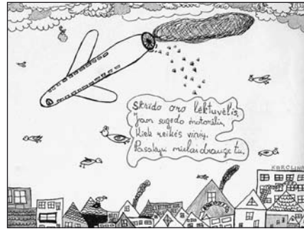
VDU ER 2069/6

Skrido oro lēktuvēlis, Jam sugedo motorēlis. Kiek reikēs vinių, Atsakysi, drauge, tu! (VDU ER 2061/8).