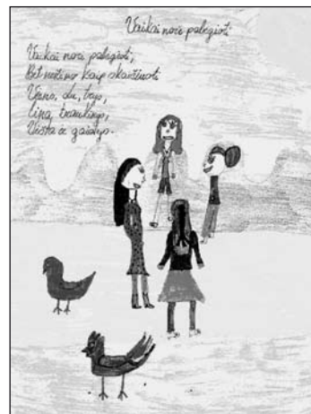
VDU ER 2066/1

Pamarskomu 1. 2. 3., ir jūreivis nuplukdys (VDU ER 2068/12).