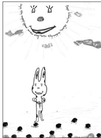
VDU ER 2066/8