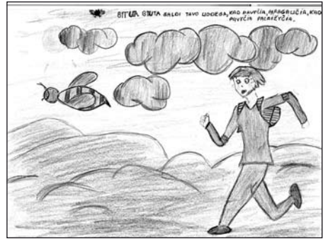
VDU ER 2063/21